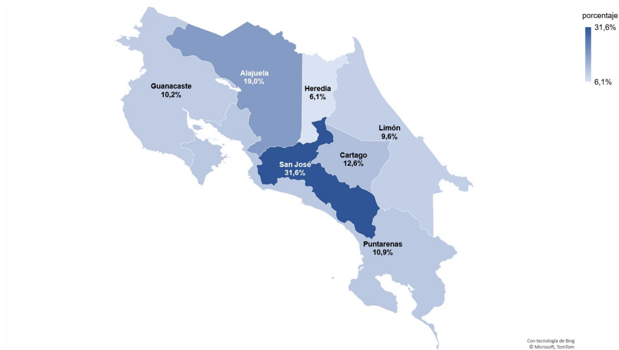
Ilustración 1. Distribución de las personas menores de edad aprehendidas por la Fuerza Pública, según provincia de ocurrencia del evento 2018-2020

Adicionalmente el cuadro 4, muestra la densidad de población para cada una de las provincias y se aprecia que la mayor densidad se da en el valle central 4 sumado a que la mayor frecuencia y cantidad de personas menores sorprendidas en consumo o tenencia también se da en esta zona.