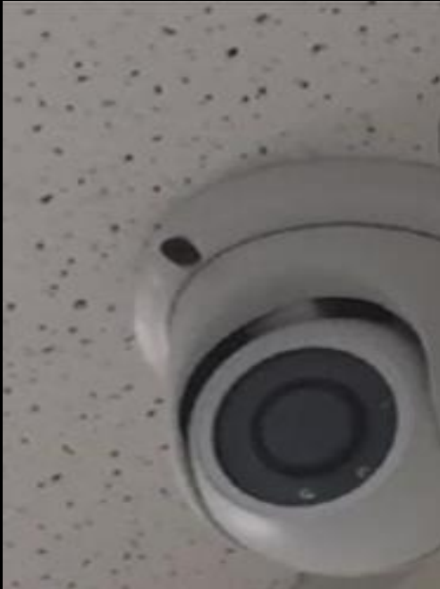
CIRCUITO CERRADO DE TELEVISIÓN