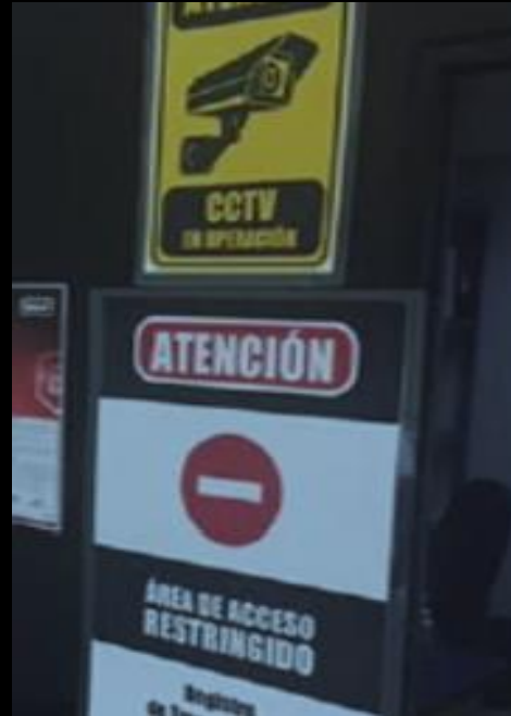
DIGITALIZACIÓN DE LA INFORMACIÓN