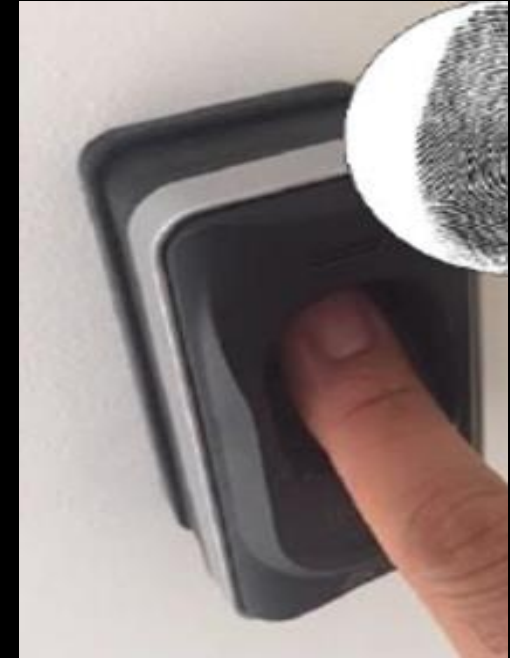
ACCESO CONTROLADO POR BIOMETRÍA